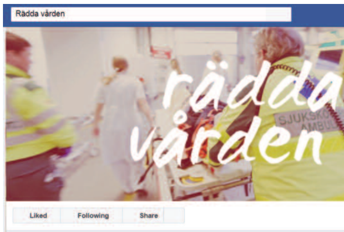
Den högst patientsäkerhetsstilla Facebook-sidan "Rädda vården" pekades snabbt ut som högerextrem, trots att inga sådana åsikter någonsin uttrycktes där.