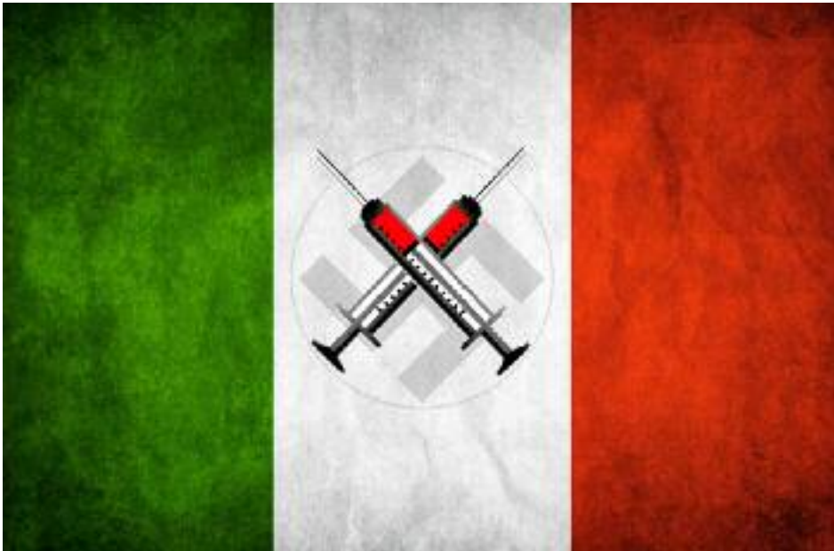
Så här kanske den italienska flaggan kan komma att se ut inom en inte alltför avlägsen framtid.

är: difteri, hepatit B, Hib, kikhosta, meningit B och C, mässling, polio, påssjuka, röda hund, stelkramp och vattkoppor.