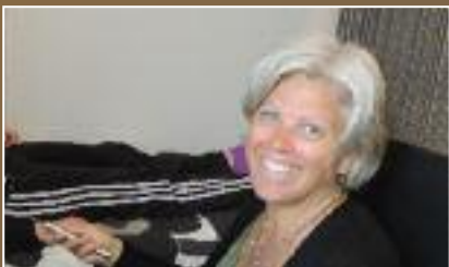
Bioresonans botar många