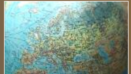
Ersättning för vård inom EU