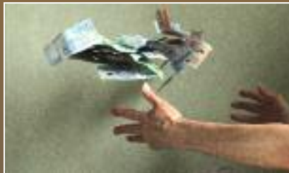
Bankerna styr vår ekonomi